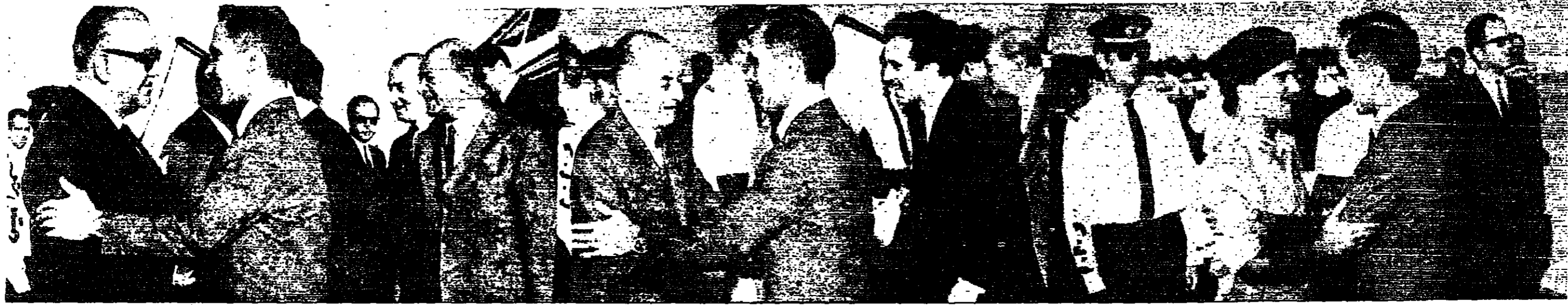
عمان - ١١ - عاد الى عمان بعد ظهر أمس جلالة الملك الحسين المعظم بعد ان اجريت لجلالته عملية جراحية ناجحة في احد مستشفى لندن وعاد في معه جلالة سمو الامير محمد المعظم والحكتور شحات الساطي الطبيب الخاص والسيد زيد الرفاعي الامين العام للليونان الملكي الهاشمي . وقد جرى اجلاء الحسين في مطار عمان استقبال رسمي حافل . وكان في مقدمة المستقبين سمو الامير حسن ولي العهد المعظم ووجوه السيد بهجت الطهوني رئيس الوزراء ، وسعادة الشريف حسين بن ناصر رئيس اللينان الملكي الهاشمي ، ورئيس مجلس الاعيان والقواب ، والوزراء ، والاعيان والشواب ، وروساء الهيئات القبلية ، وكبار رجال الدولة والجيش والامن العلم .

تسليم فيينا - د.ب.أ - اخذت اللقطة المركزية للحزب الشيوعي في مقاطعة سوفيا قرارا برفض اي سمي أو محاولة لفصل بلديتها عن جمهورية تشيكوسلوفاكيا وتحولها الى دولة مستقلة . وقالت محطة اذاعة تشيكوسلوفاكيا الحرة ان مؤتمر اللجنة المركزية الذي انعقد أمس في برايسلاف عاصمة سلوفاكيا اتخذ قرارا بشجب الاحتفال السوفياتي لتشيكوسلوفاكيا ، وافضهها على نفسه بالضي على طريق الاشتراكية ، واعلان ان السوفيات يريدون الجيش موحد في دولة تدرالية شيكية . البقية على الصفحة الخامسة عمود ٦